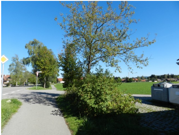
Abbildung 11: Kreuzungspunkt zweier Fuß- und Radwege im Plangebiet