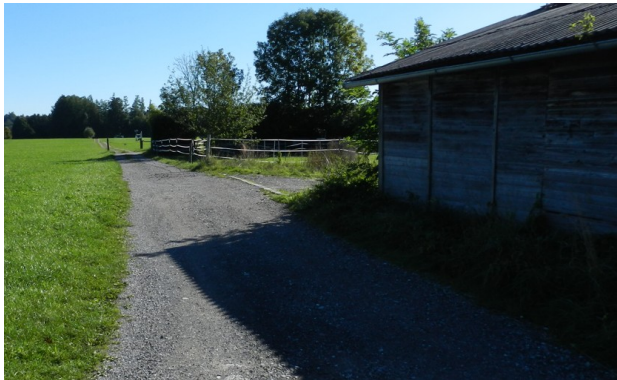
Abbildung 12: Schuppen im Plangebiet