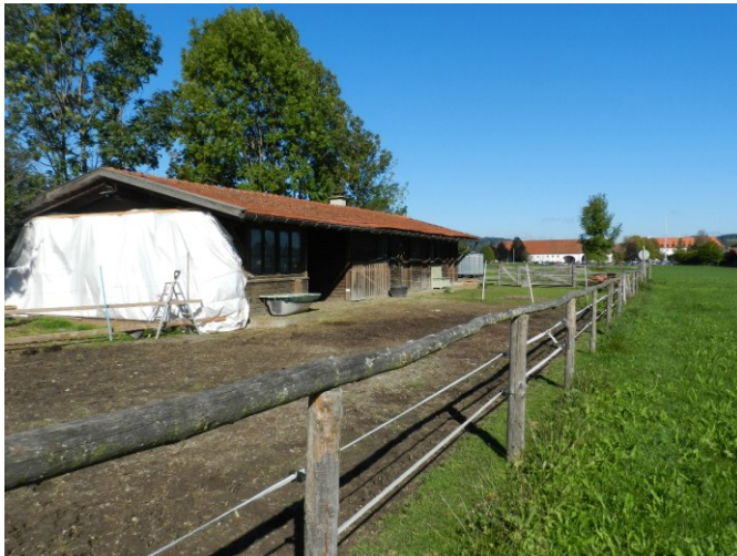
Abbildung 9: Vegetationsfreie Fläche mit stark verdichtetem Boden als Tiergehege