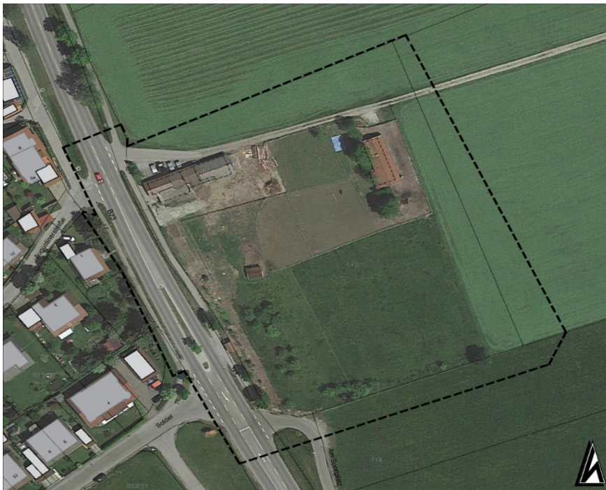
Abbildung 1. Lage des Plangebiets.

Im Landkreis Weilheim-Schongau plant die Gemeinde Rottenbuch die Errichtung eines zukunftsfähigen Nahversorgungszentrums mit einem EDEKA-Vollsortimenter. Das Versorgungszentrum ist mit 1200 m 2 geplanter Verkaufsfläche als großflächiger Einzelhandel einzustufen. Zusätzlich ist der Bau eines Feuerwehrhauses (Flur-Nr. 112/1) vorgesehen. Parallel dazu ist auf dem Gelände die vorübergehende Aufstellung einer Containerschule vorgesehen.