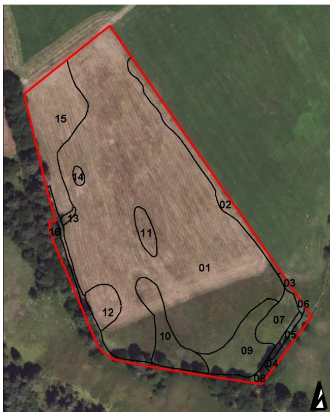
Abbildung 14: Lage der Ausgleichfläche. Die Zahlen 1-16 stellen Teilflächen dar. Quellen: Luftbild: Geoportal Bayern 2024; Teilflächen: Beckmann und Beckmann 2022.

Bei den Erhebungen im Jahr 2022 wurden auf dem Flurstück insgesamt 84 Gefäßpflanzenarten registriert. Darunter befinden sich 13 Arten (Tabelle 3), die in Bayern im Rückgang begriffen oder gefährdet sind. Die Durchführung der Maßnahmen in den Ausgleichsflächen dürfen diese Arten in ihrem Lebensraum nicht beeinträchtigen (Beckmann und Beckmann, 2022). Die Bestände dieser Gefäßpflanzenarten dürfen von der Durchführung der Ausgleichsmaßnahmen nicht beeinträchtigt werden.