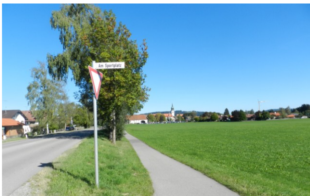
Abbildung 13: Fuß- und Radweg sowie die Bundesstraße B 23