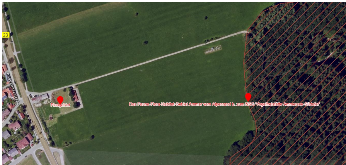
Abbildung 2: Angrenzendes FFH-Gebiet.