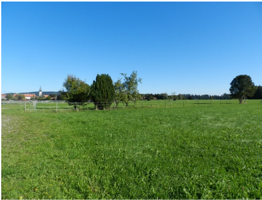
Abbildung 6: Baumgruppe und Einzelbaum aus überwiegend autochthonen Arten