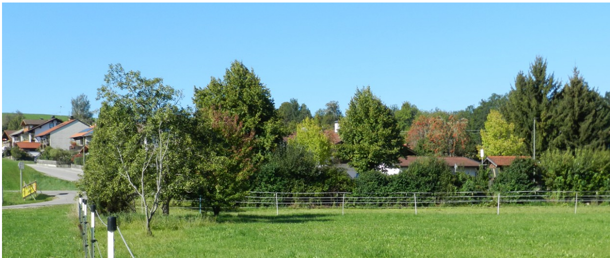
Abbildung 5: Blick auf die Strauchhecke entlang der südwestlichen Seite des Plangebiets

Einzelbäume und Baumgruppen stehen vereinzelt in der offenen Landschaft des Plangebiets. Es handelt sich dabei um einzelne Laubbäume sowie um eine lockere Gruppe von Einzelbäumen, bei der die Strauch- und Krautschicht fehlt oder nicht walddtypisch ist. Zudem sind einzelne Bäume aus der Familie der Zypressengewächse sowie der Kieferngewächse vorhanden. Im Plangebiet sind folgende Einzelbaumarten zu finden: Kultur-Birne ( Pyrus communis ), Lawsons Scheinzypresse ( Chamaecyparis lawsoniana ), Bergkiefer ( Pinus mugo ), Gemeine Esche ( Fraxinus excelsior ) (Abbildung 6).