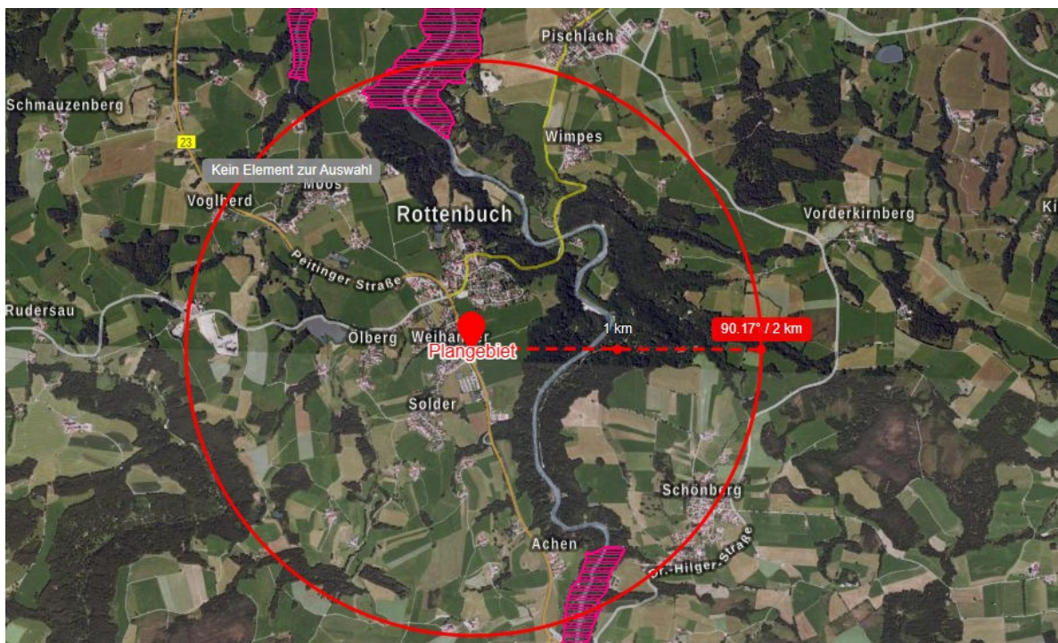
Abbildung 3: Angrenzende Naturschutzgebiete im Umkreis von 2 km. Nördlich angrenzend: Ammertal im Bereich der Ammerleite und Talbachhänge. Südlich angrenzend: Ammerschlucht an der Echelsbacher Brücke.