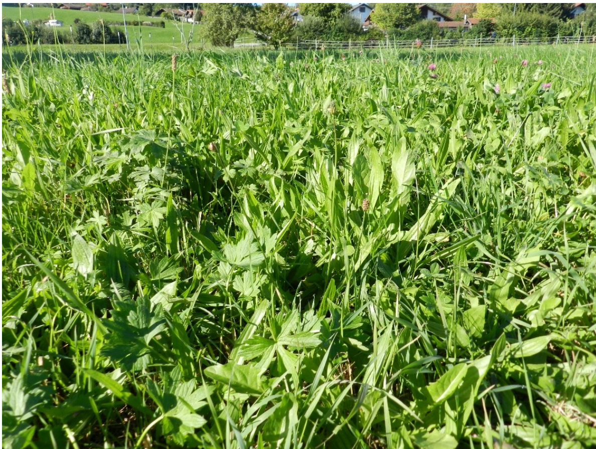
Abbildung 4: Das Intensivgrünland-Biotop im Plangebiet

Das Biotop B112 im Plangebiet setzt sich überwiegend aus einheimischen und standortgerechten Gehölzarten von mesophilen Standorten zusammen. Diese Gehölzflächen befinden sich entlang der südwestlichen und nordöstlichen Seite des Plangebiets. Zu den vorherrschenden Gehölzarten gehören Sträucher wie Roter Hartriegel ( Cornus sanguinea ), Gemeine Hasel ( Corylus avellana ), Purpur-Weide ( Salix purpurea ), Gewöhnlicher Spindelstrauch ( Euonymus europaeus ) sowie Bäume wie Winterlinde ( Tilia cordata ), Gemeine Esche ( Fraxinus excelsior ), Berg-Ahorn ( Acer pseudoplatanus ) und Asch-Weide ( Salix cinerea ) (Abbildung 5).