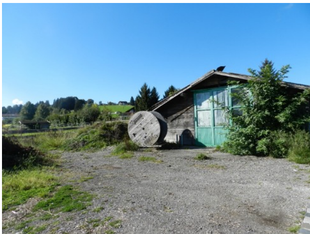
Abbildung 10: Schuppen auf der nordwestlichen Seite des Plangebiets, mit einer Land- und forstwirtschaftlichen Lagerfläche