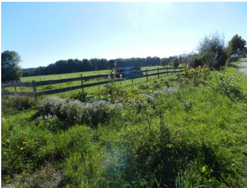
Abbildung 7: Artenarme Säume und Staudenfluren blick nach Südosten über das Plangebiet

Im Plangebiet befindet sich dieses Biotop auf geschotterten Flächen. Charakteristisch für diese artenarme Ruderalflächen sind v.a. einjährige Pflanzenarten, die sich gut an durch Menschen verursachte Störungen angepasst haben. Es sind robuste und konkurrenzstarke Pionierpflanzen, die sich auf freien Flächen des Plangebiets angesiedelt haben. Hier zeichnet