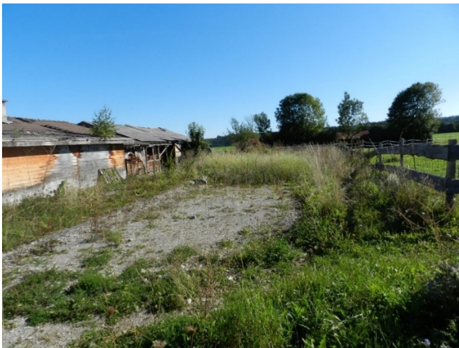
Abbildung 8: Blick nach Osten über das Plangebiet (Wirtschaftsweg, geschottert)

Es handelt sich um Lagerflächen der land- und forstwirtschaftlichen Nutzung, die sich im Bereich von Ackerflächen oder Ackerbrachen befinden. Dieses Biotop weist nur eine geringe Habitateignung für Tiere auf.